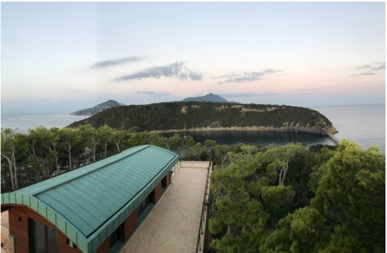
Il Dojo del Centro SaMa. Oltre l'isoletta di Vivara, all'orizzonte il monte Epomeo, Ischia.

La quota di partecipazione verrà rimborsata solo se non si raggiungesse il numero minimo di partecipanti. INFO | info@danzeantiche.org