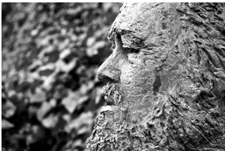
Busto di Big Luciano, Villa Giulia, Pesaro

Vice Presidente vicaria WunderKammer Orchestra e presidente Ass. culturale Il Boncio (già presidente onorario A.D.A. Associazione Danze Antiche)