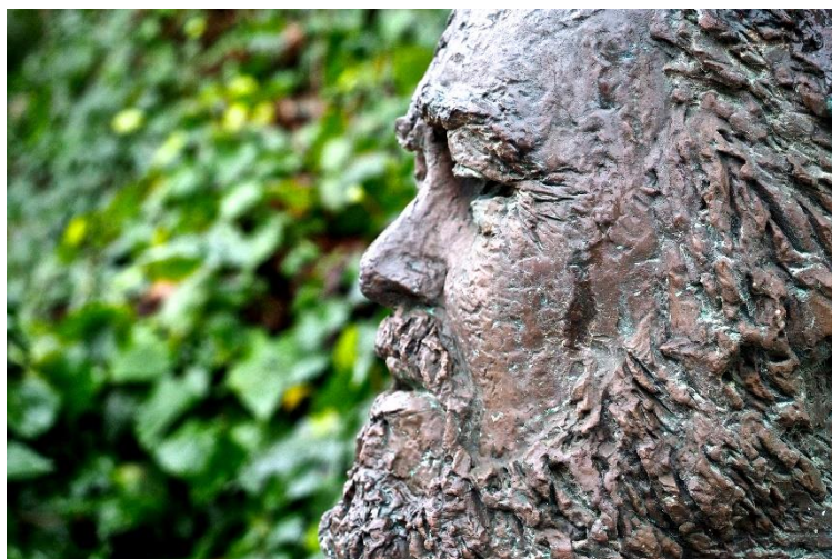
Busto di Big Luciano, Villa Giulia, Pesaro

Presidente Ass. Il Boncio e presidente onorario A.D.A.