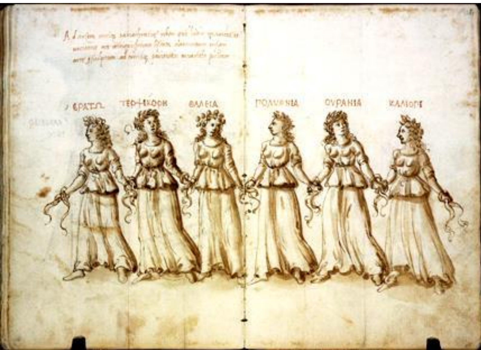
da Ciriaco de' Pizziccoli detto d'Ancona (Ancona, 31 luglio 1391 - Cremona, 1452), La Carola delle Muse , Firenze, Biblioteca Medicea Laurenziana.